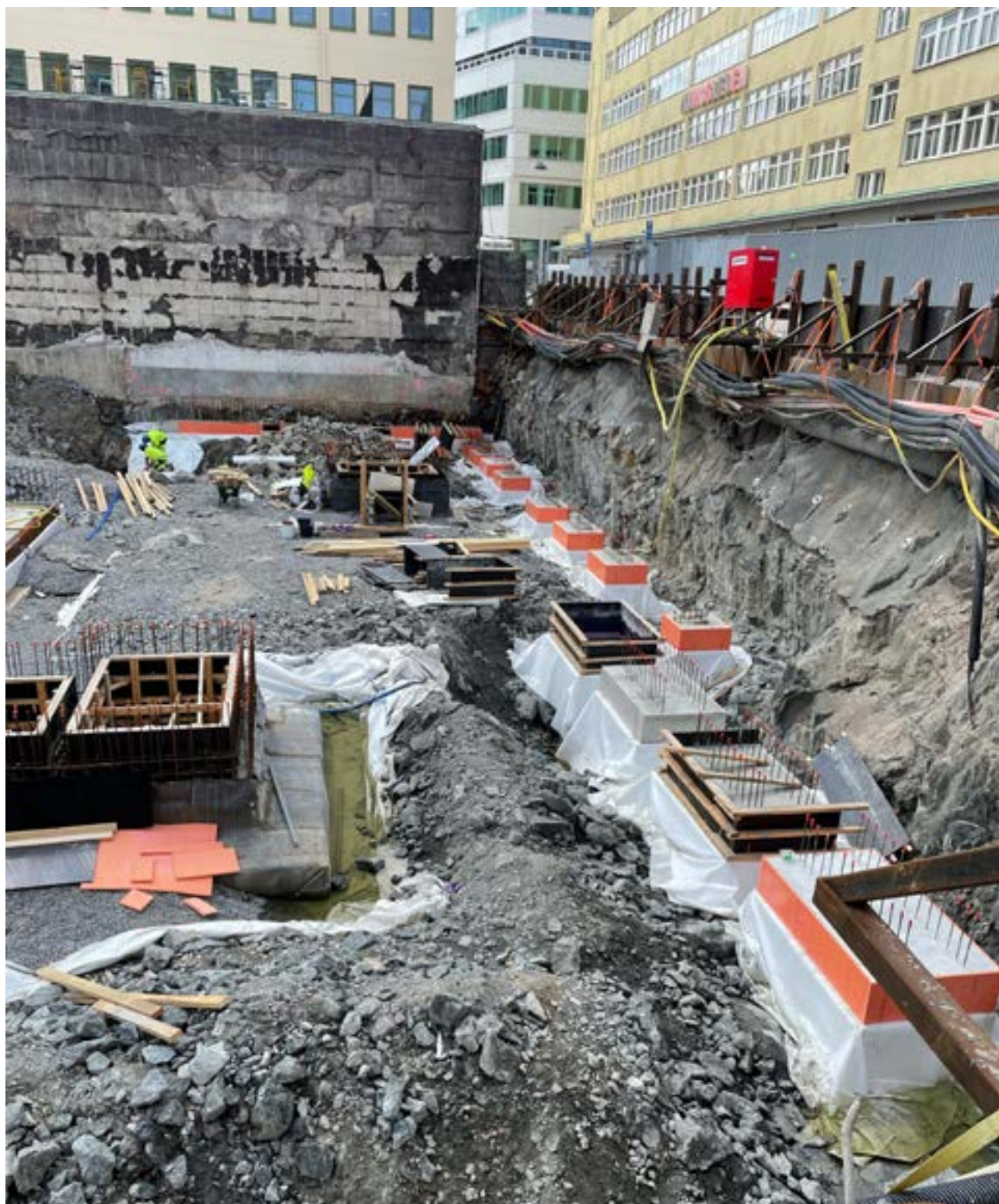
Gladan 3, Stadshagen Stockholm augusti 2022.

Besöksadress: Stillestorps Industriväg 8 443 61 Stenkullen